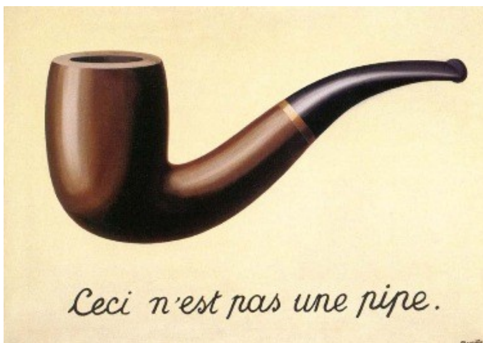
Figure 1: Pourtant mon modèle est certain qu'il s'agit d'une pipe ! - La Trahison des images , René Magritte, 1928-29, LACMA.

Pour travailler sur des collections patrimoniales, nous allons nous intéresser à des technologies de vision par ordinateur (ou computer vision ). Ces technologies ont comme point commun de partir d'images pour en extraire les informations que l'on recherche. Les principaux usages de ces technologies vont être par exemple les véhicules autonomes, ou le traitement d'imagerie médicale. Si elles sont très puissantes, très peu de ces technologies sont nativement adaptées au contexte patrimonial. Leur usage « commercial » premier leur permet grossièrement de ne considérer les images que sous l'angle de leurs caractéristiques visuelles directes.